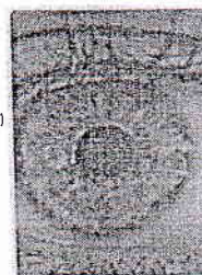
Основные признаки гепатитов

Единственный способ уберечься от гепатита В — вакцинация. Вакцинация против гепатита В включена в Национальный календарь профилактических прививок. Проводится в первый день жизни ребенка, курс вакцинации состоит из трех-четырех прививок. Также вакцинация проводится взрослым до 55 лет, не болевшим, не привитым, не имеющим сведений о проведенной вакцинации.